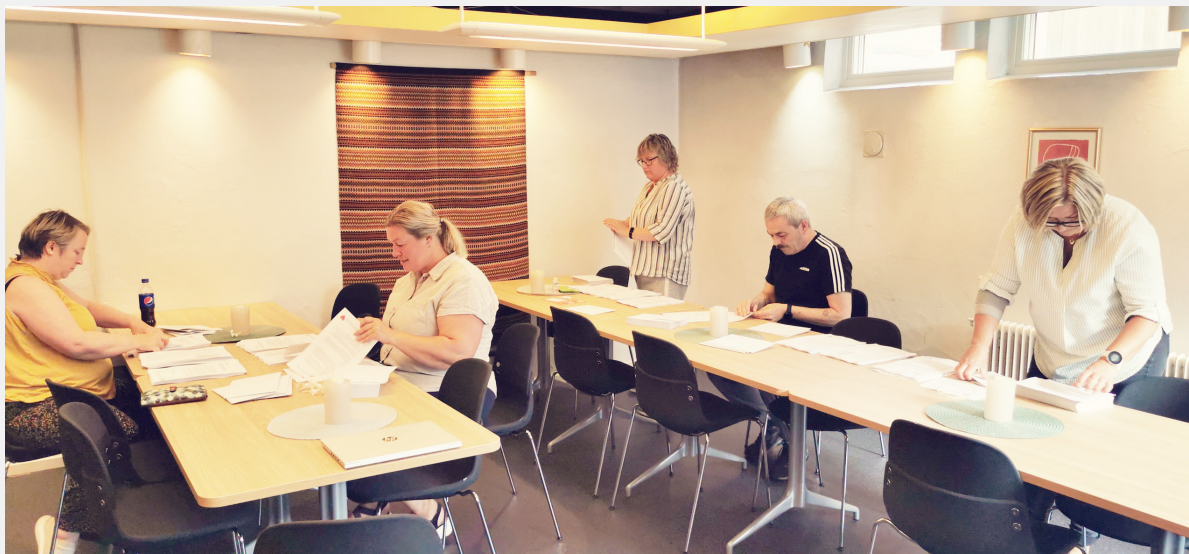
Driftig gjeng som ordna med utsending av medlemsbrev.

Nyvalt på årsmøtet 2021 og var på første styremøte i slutten av juni 2021. Har brukt hausten på å få oversikt over medlemmene som har meg som kontaktperson, og oppdatert medlemsregisteret. Eg har fortløpande sendt vidare informasjon om kurs og generell informasjon frå Fagforbundet sentralt til desse. Eg har delteke på kurs i regi av Fagforbundet sentralt der eg fekk betre innsikt i kva rolla som yrkesseksjonsleiar går ut på. Eg har delteke på alle styremøte i haust, samt medlemsmøte i Sogndal. Eg har også bidratt med utsending av brev til alle medlemmane vedkomande lokale forhandlingar, pakking av julehelsingar til medlemmane samt deltaking på Fagforbundet sin bubleturné i haust.