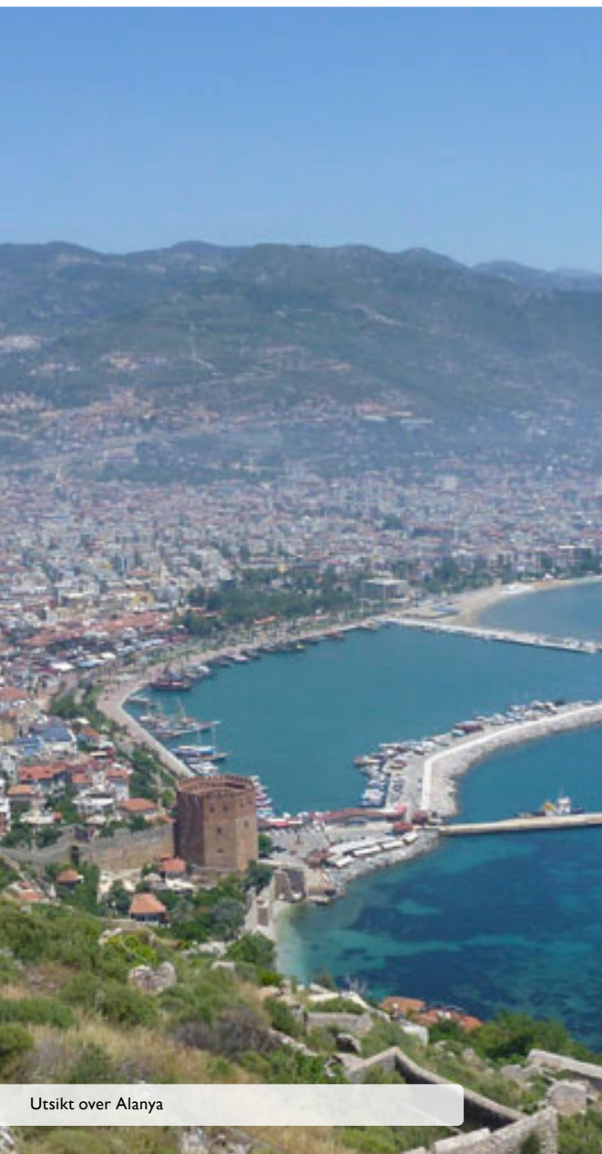
Utsikt over Alanya

“Leilighetanlegget ligger i åsen øst for Alanya sentrum, omgitt av bananlunder, med vakker utsikt over Alanya by og Middelhavet”