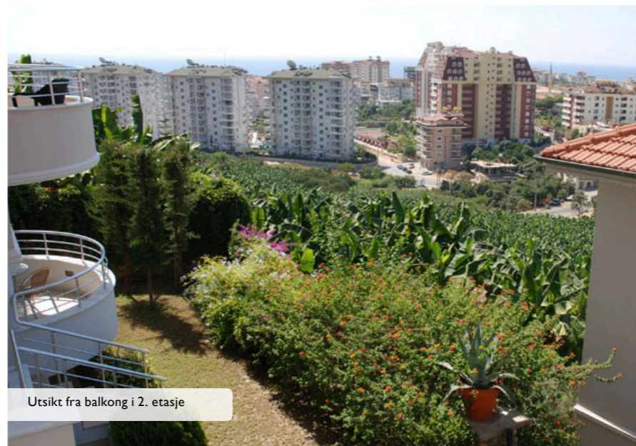
Utsikt fra balkong i 2. etasje