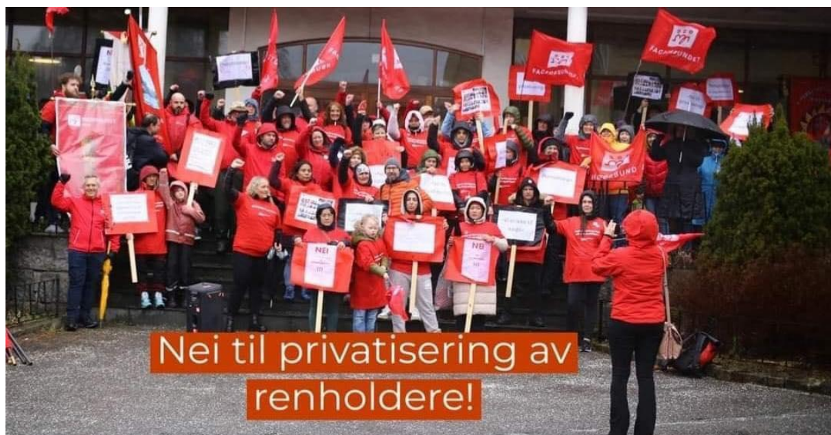
Demonstrasjon sammen med renholderne på rådhustrappa en regnfull mars ettermiddag 2024.

Behandlet av årsmøtet den 30. januar 2025.