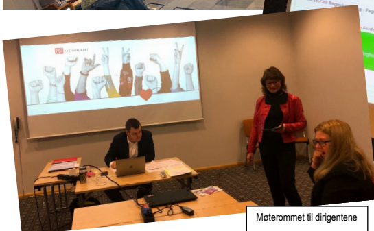
Møterommet til dirigentene