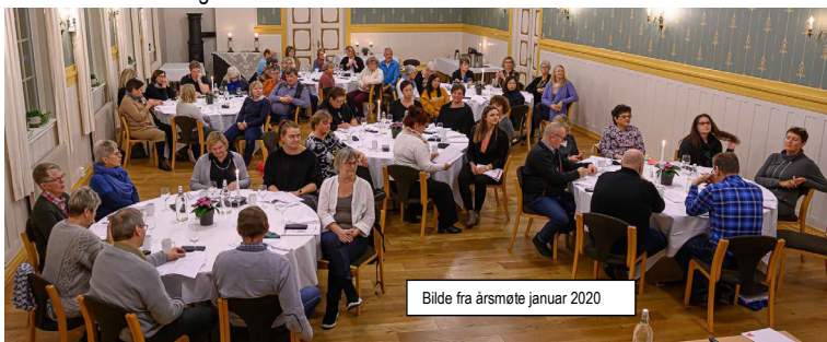
Bilde fra årsmøte januar 2020

Representanter til yrkesseksjonskonferansen, pensjonist og ungdomskonferansen i fylket er lederne i utvalgene.