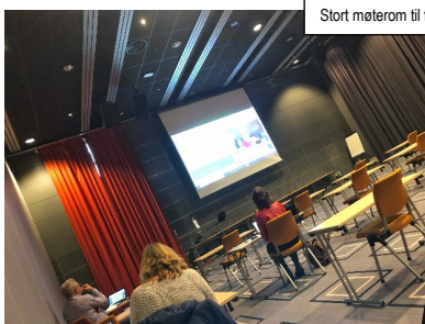
Stort møterom til få